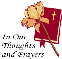
In Our Thoughts and Prayers