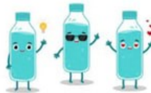
Cold Bottled Water