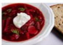
Borsch (Beet Soup)