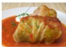
Holubtsi (Stuffed Cabbage)