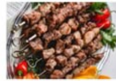
Shashlyk (Marinated Pork Kabob)