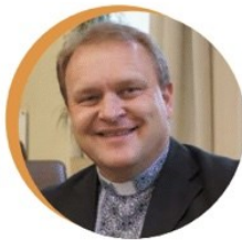
о. о-р Богдан Тимчишин Стемфордська єпархія УГКЦ

З благословення преосвященнішого владика Богдана Данила (Пармська єпархія святого Йосафата)