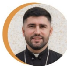
о. Остап Микитчин Філадельфійська Архиепархія УГКЦ