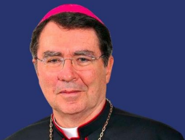
MODERATED BY H.E. Christophe Cardinal Pierre

A shared journey for teachers, parents, and people of goodwill